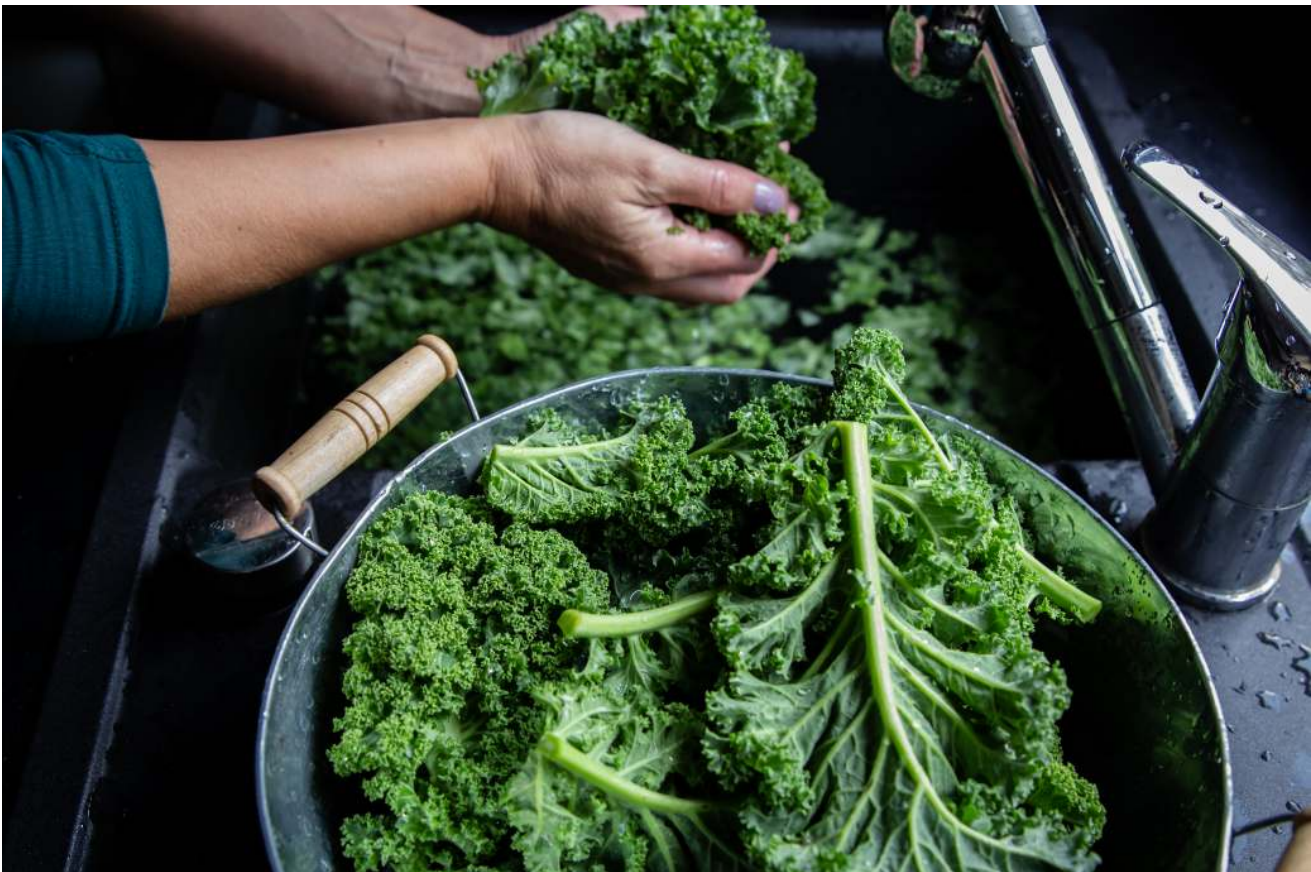
Figur 30: Bladgrönsaker tillhör de vanligaste livsmedel som kan kopplas till utbrott av kryptosporidios. Ett stort antal diagnosticerade fall kunde år 2023 kopplas till konsumtion av grönkål.

Sjukdomen hos människor kan variera från symtomfri till svår infektion. Smitt dosen är låg och inkubationstiden varierar från 2 till 12 dagar. Symtomen, som normalt varar i upp till 2 veckor, inkluderar måttlig till svår vattmig diarré, feber, magkramper, illamående och kräkningar. Kronisk diarré och feber förekommer hos personer med uttalad immunbrist, såsom obehandlad HIV med låga CD4-celltal.